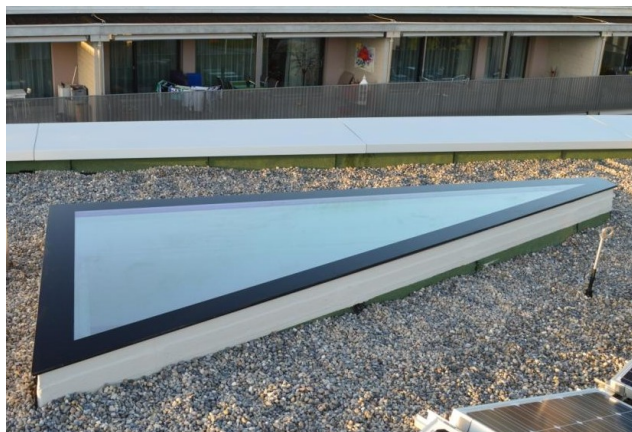
Lanterneau dans une forme triangulaire spéciale.