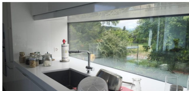
Vitrage sans cadre dans une cuisine.