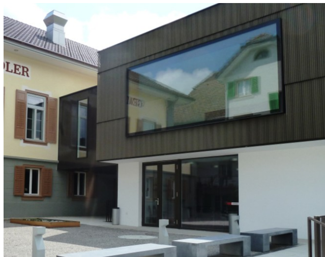
Fenêtre panoramique montée vers l'avant.