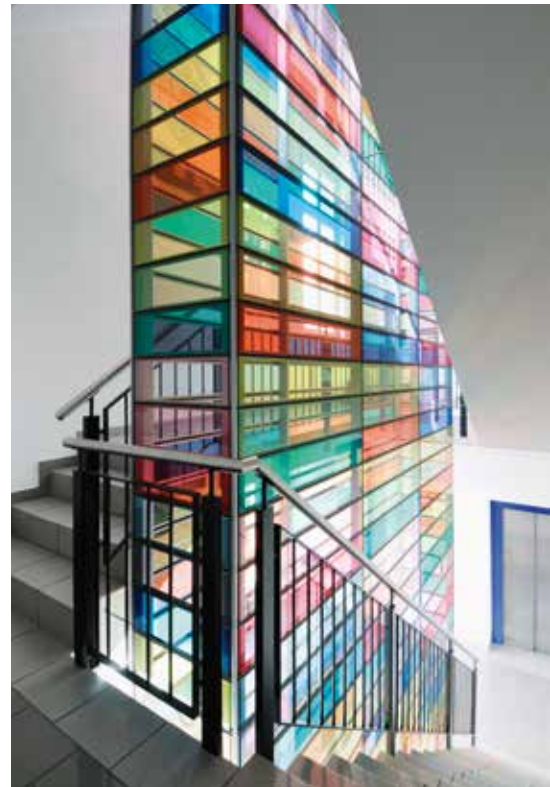
Services psychiatriques Thounne / architecte: Zellweger Architekten AG