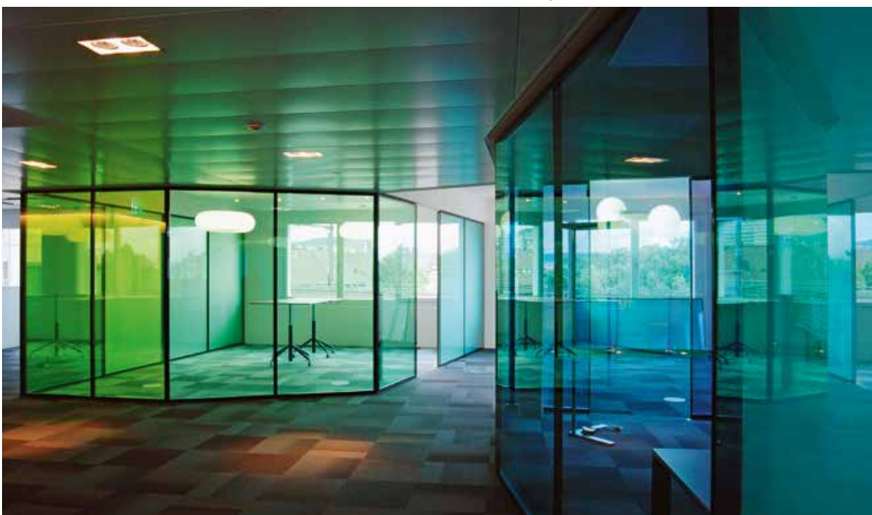
SAM Zurich / architecte: Andreas Carosio