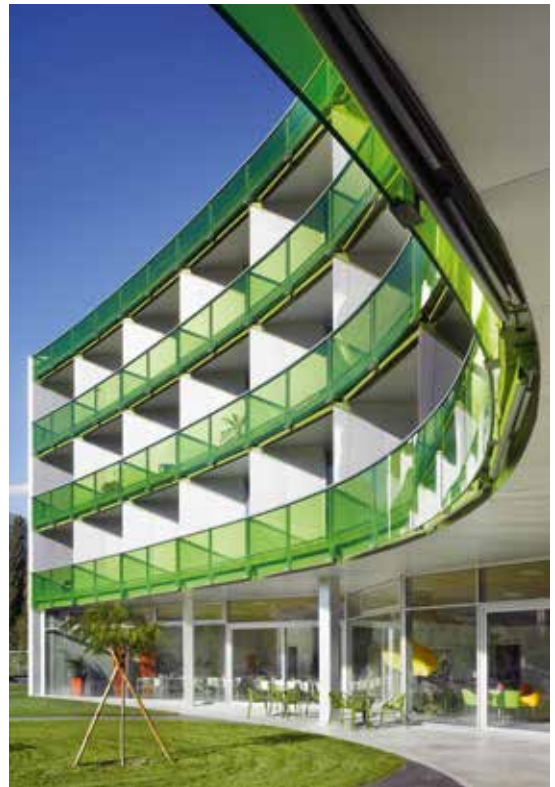
Valais de Cœur à Sion

SWISSLAMEX COLORDESIGN se caractérise par une remarquable stabilité des couleurs. Ses propriétés restent intactes même lorsqu'il est exposé au soleil, à la pluie et aux intempéries. Utilisé comme verre isolant, il affiche d'excellentes propriétés en termes d'isolation thermique, de protection solaire et de protection incendie et offre des solutions architecturales intéressantes. L'épaisseur du verre est calculée au cas par cas en fonction de la statique et peut également être déterminée selon des critères esthétiques.