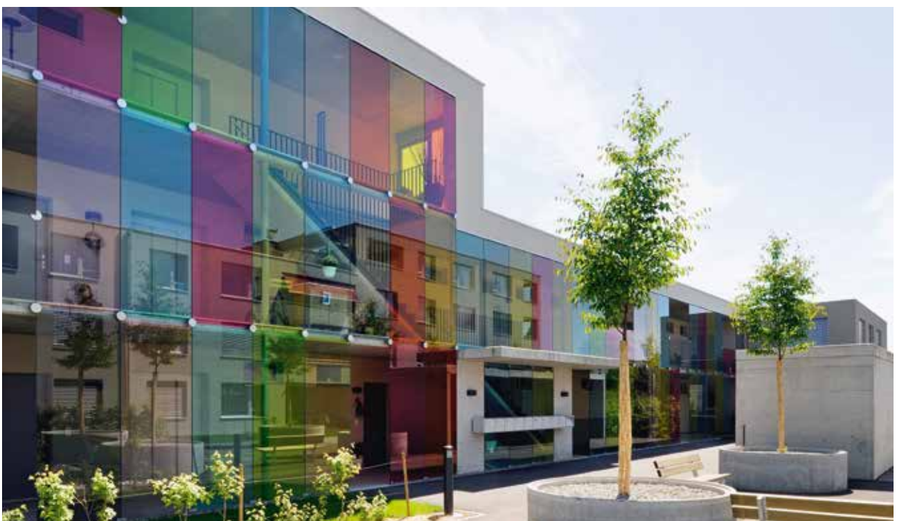
Immeuble Kilchwies