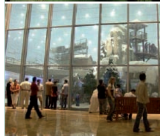
Mall of Emirates, Ski Center, Dubai